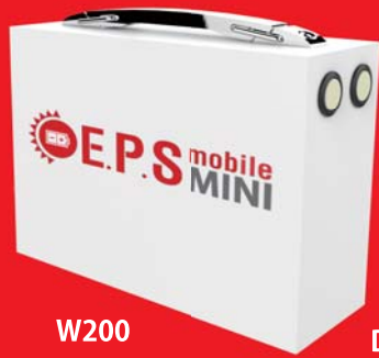
EPSmobile MINI 本体